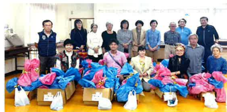
11/14見守り交流事業の出発前(地域福祉部)

ボランティアに興味がある方、地域に貢献したい方はご連絡ください。仲間と明るく楽しい時間を過ごしませんか？