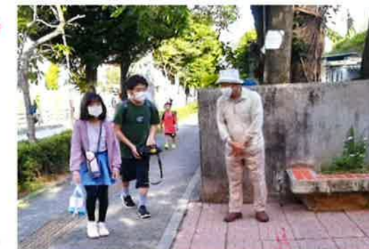
朝のあいさつ運動(児童福祉部)