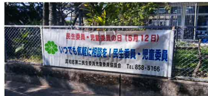
「民生委員・児童委員の日」横幕掲示(広報部)