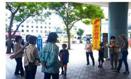
赤い羽根募金活動(全体活動)