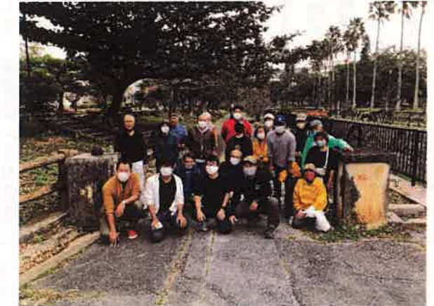
地域見守りマスク配布とフレデー フードドライブ (与儀小・真和志小・町づくり協議会)