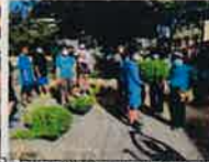
安謝自治会へ花の節の贈呈