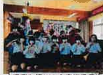
安里お祝いの会実行委員