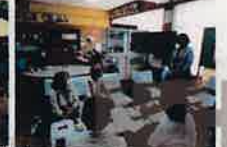
民生委員の研修との情報交換