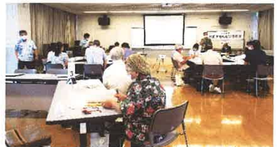
首里地区地域福祉懇談会 7/26 県センター