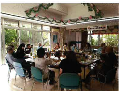
石嶺ハイツの皆さん